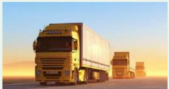
Trasporti Logistica avanzata