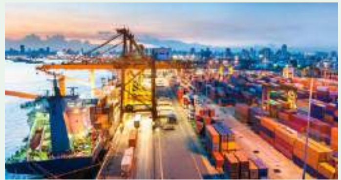
Attività di Import/Export e G.D.O.