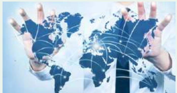
ITC: tecnologie dell'informazione e comunicazione