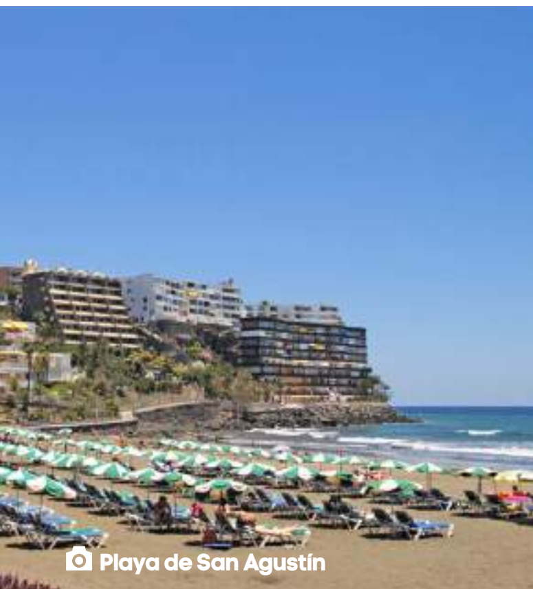
📍 Playa de San Agustín

La spiaggia di San Agustín è ideale per il turista a caccia di relax e della possibilità di godersi sia il clima che l'atmosfera subtropicale di Gran Canaria; la caratteristica principale infatti di questa località sta nel fatto che gli alberghi sono isolati e distanziati gli uni dagli altri ed immersi in lussureggianti giardini che confinano con la spiaggia sabbiosa. La vicinanza a Playa del Inglés e le altre località, regolarmente collegate con servizi di autobus, lascia aperte tutte le opportunità per distrazioni notturne.