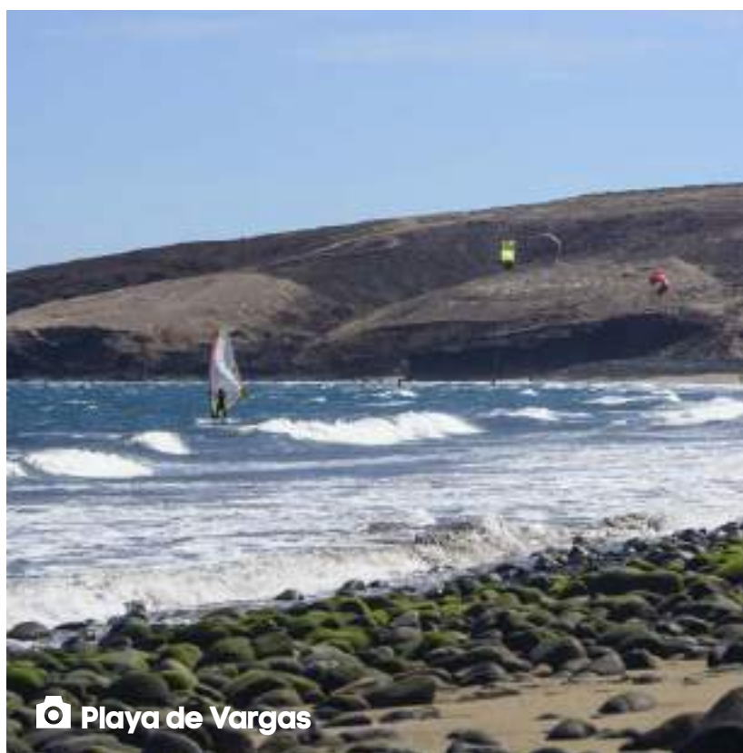
Playa de Vargas

Gli spots più apprezzati sono ubicati a Ojos de Garza, Tarajalillo, Bahía Feliz, Playa del Águila, San Agustín, Playa del Inglés, Anfi del Mar e Puerto Rico. Pozo Izquierdo è uno spot famoso a livello internazionale in quanto qui le condizioni sono sempre presenti e favorevoli tanto da essere il luogo prescelto dal pluri campione mondiale Bjorn Dunkerberck.