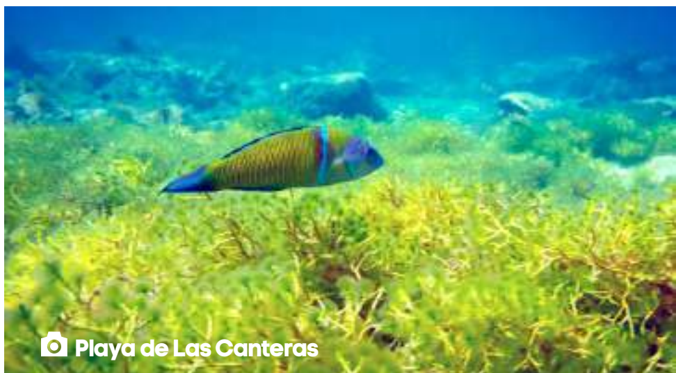
📷 Playa de Las Canteras