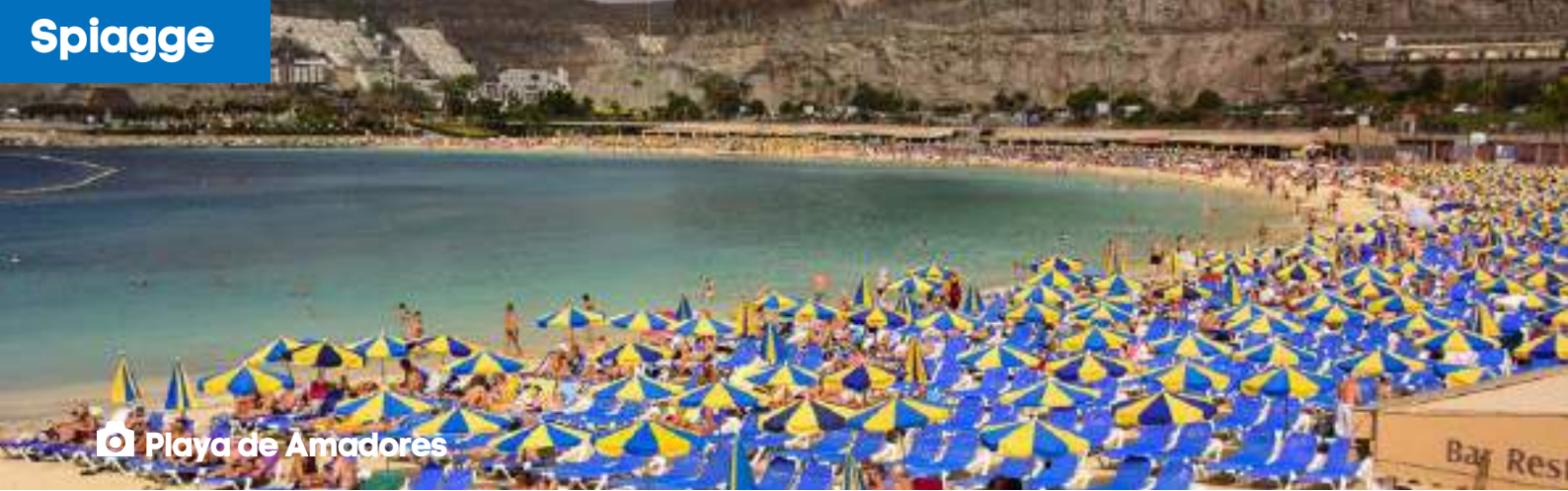
📍 Playa de Amadores