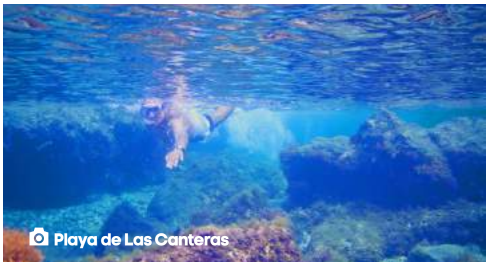
📷 Playa de Las Canteras

La Playa de Las Canteras è una delle spiagge cittadine più caratteristiche di tutta la Spagna. La passeggiata, che costeggia tutta la spiaggia, offre numerose opportunità di svago e shopping grazie alla presenza di molti negozi di diverso genere e target, come anche un momento di relax in uno dei numerosi bar e locali, tutti dotati di terrazza da dove è possibile ammirare tutto il litorale.