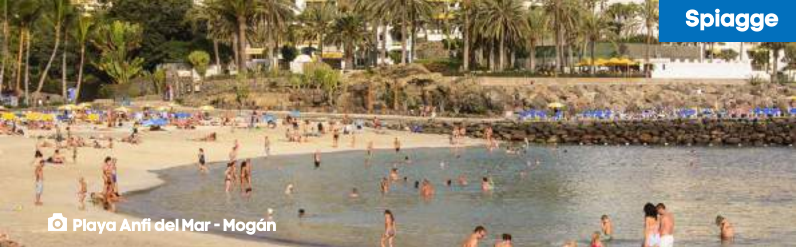
📷 Playa Anfi del Mar - Mogán